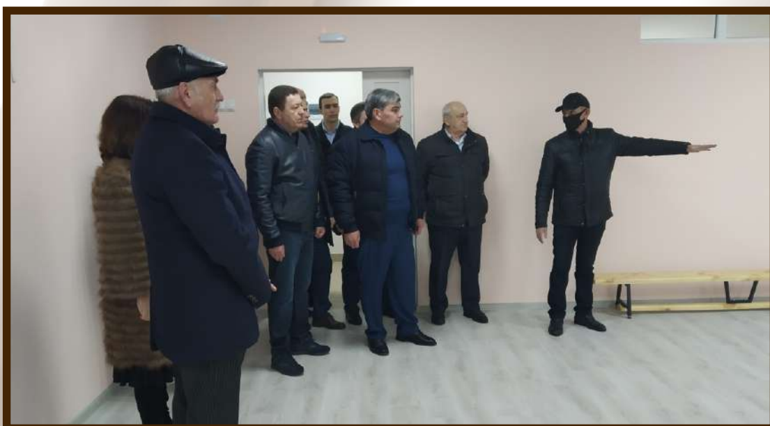
Глава Республики инспектирует помещения нового детского сада