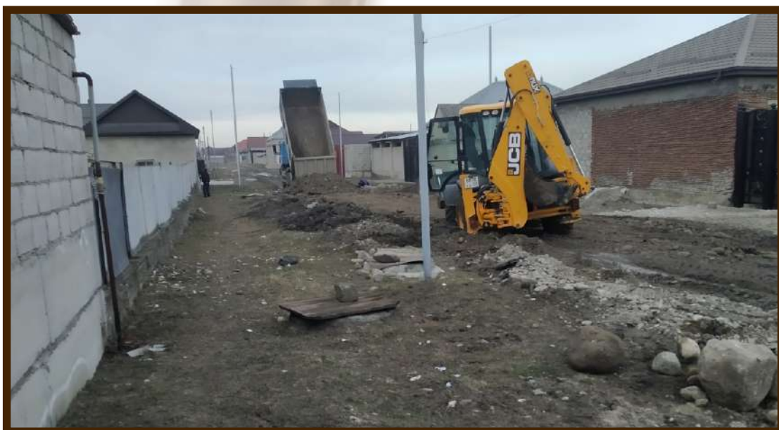
Ремонт дороги местного значения по пер. Кучменовой