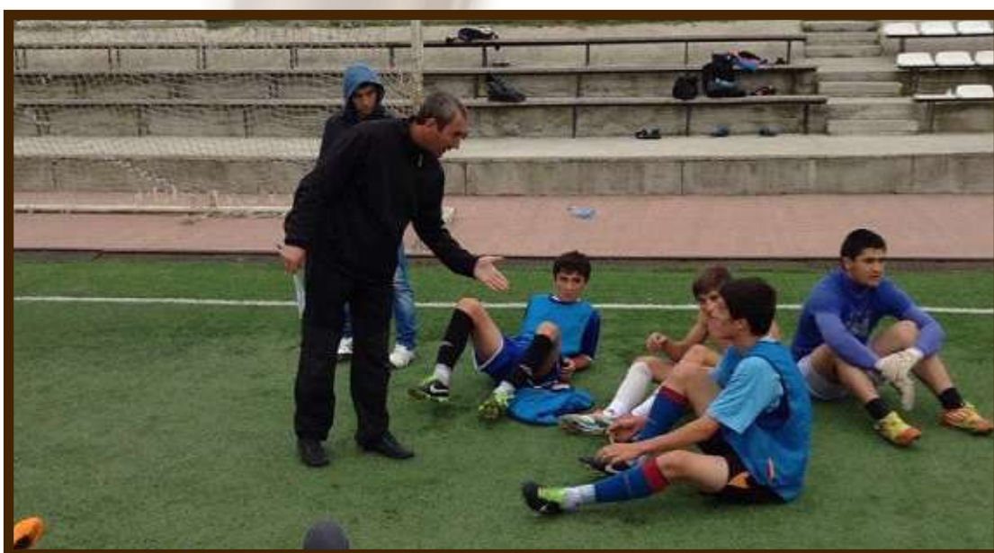
Футбольная команда с.п. Шалушка