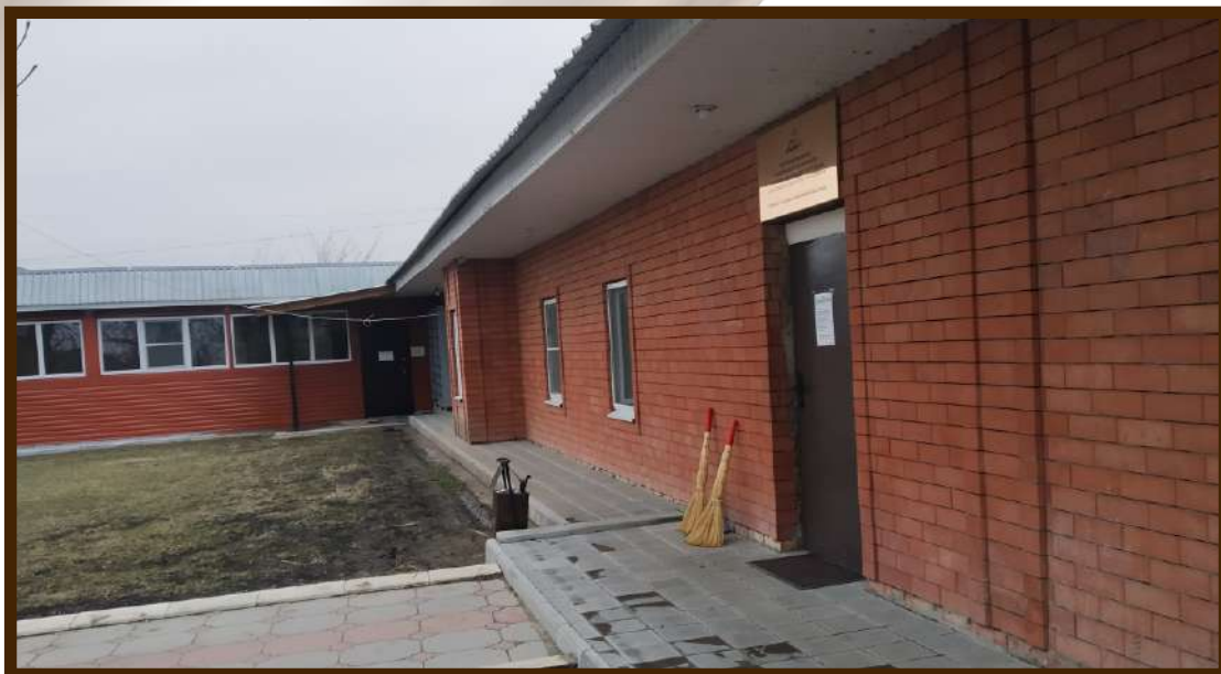
Мечеть после ремонта