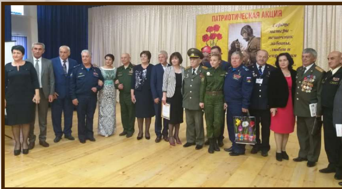
Сердце солдатской матери - патриотическая акция