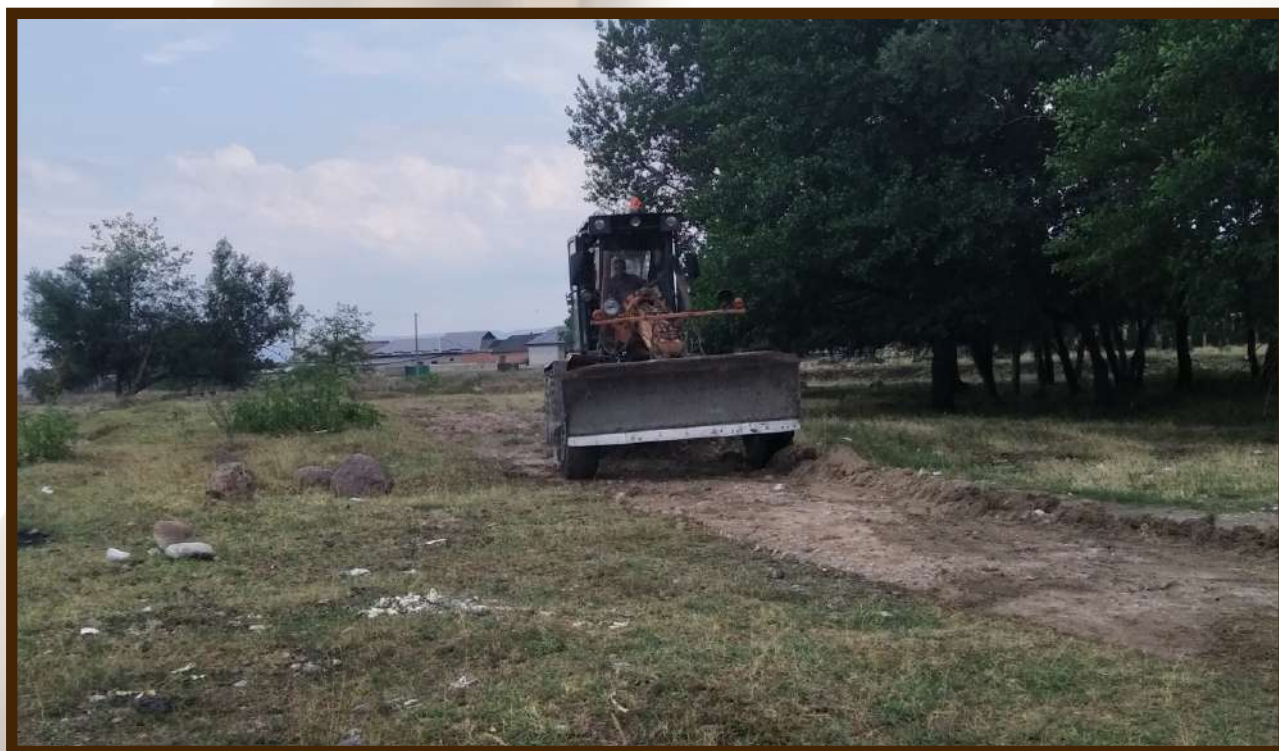
Строительство дороги местного значения в новом микрорайоне