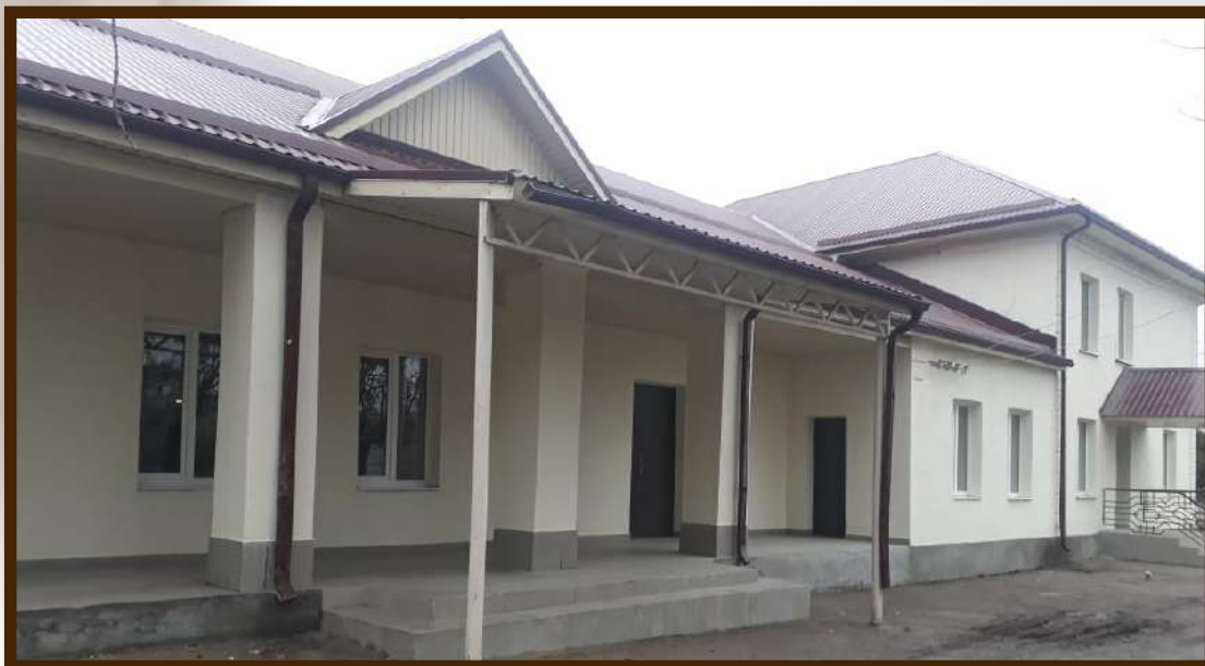
Сельский Дом культуры с.п.Шалушка