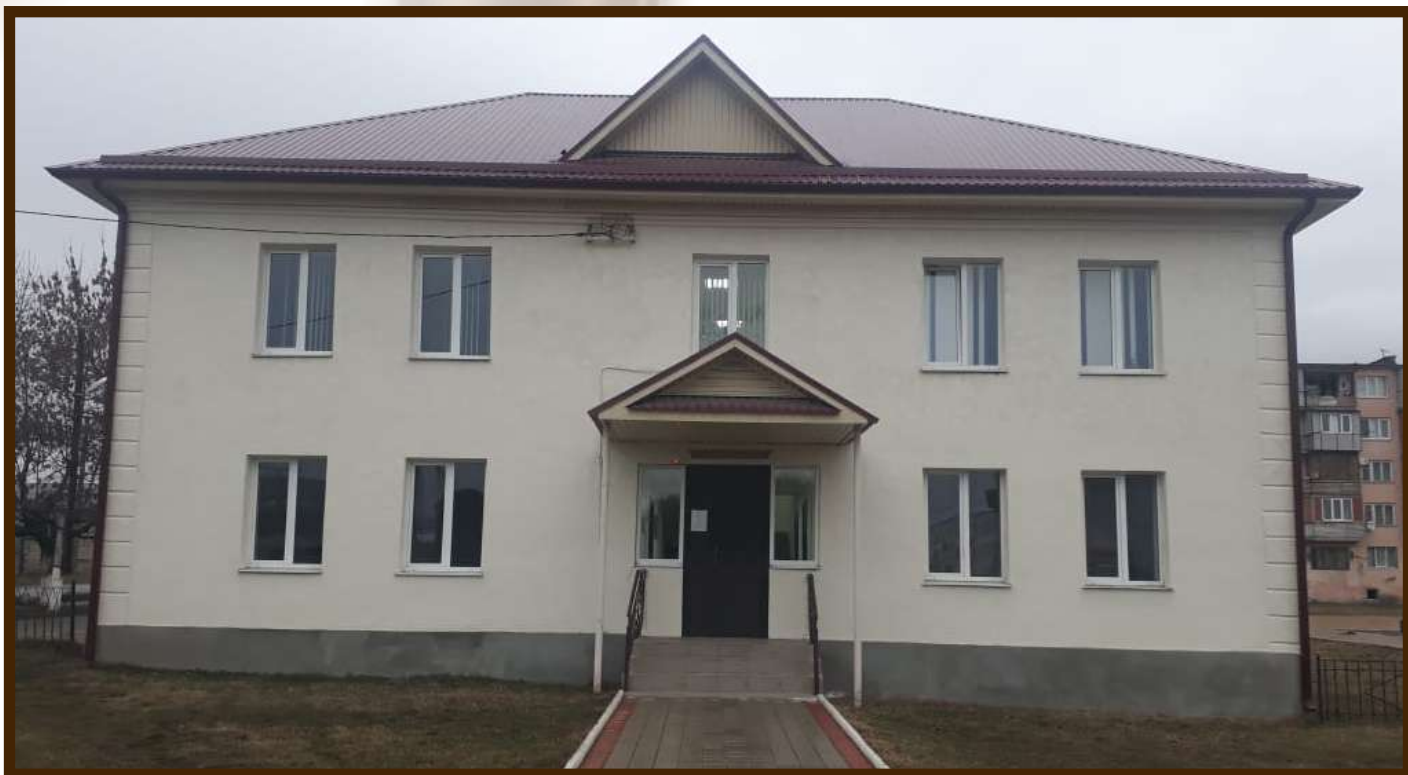
Сельский Дом культуры с.п.Шалушка