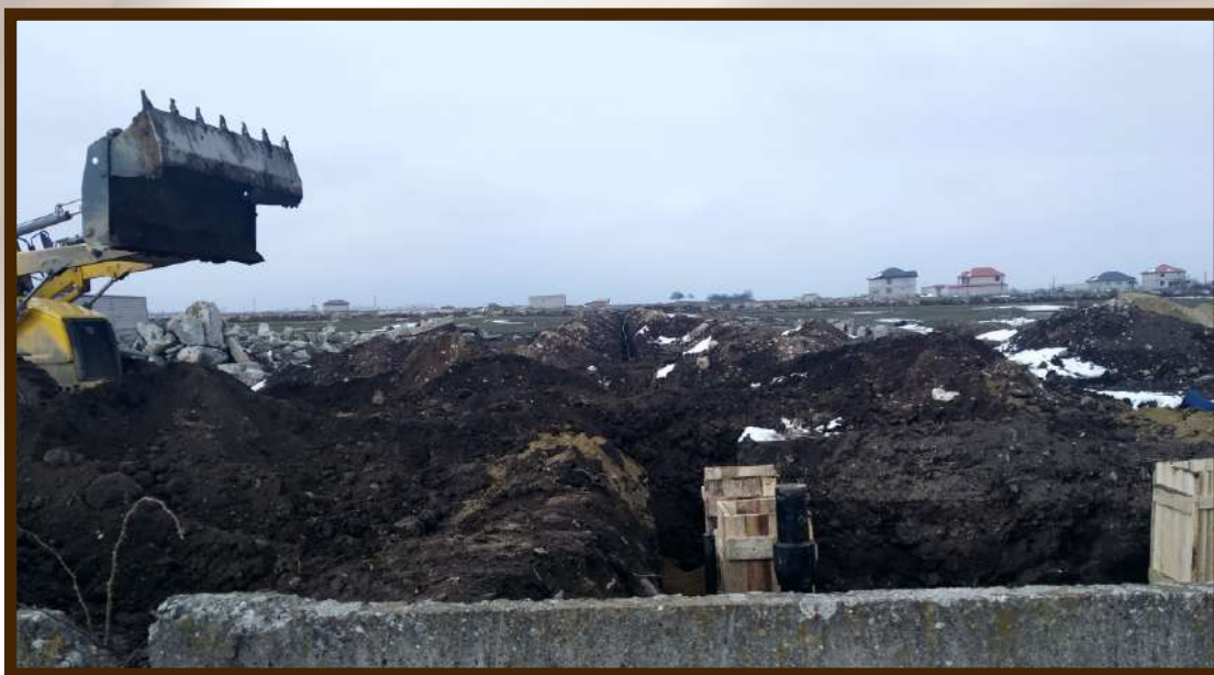
Строительство газопроводной магистрали в новом микрорайоне протяженностью 1500 м.