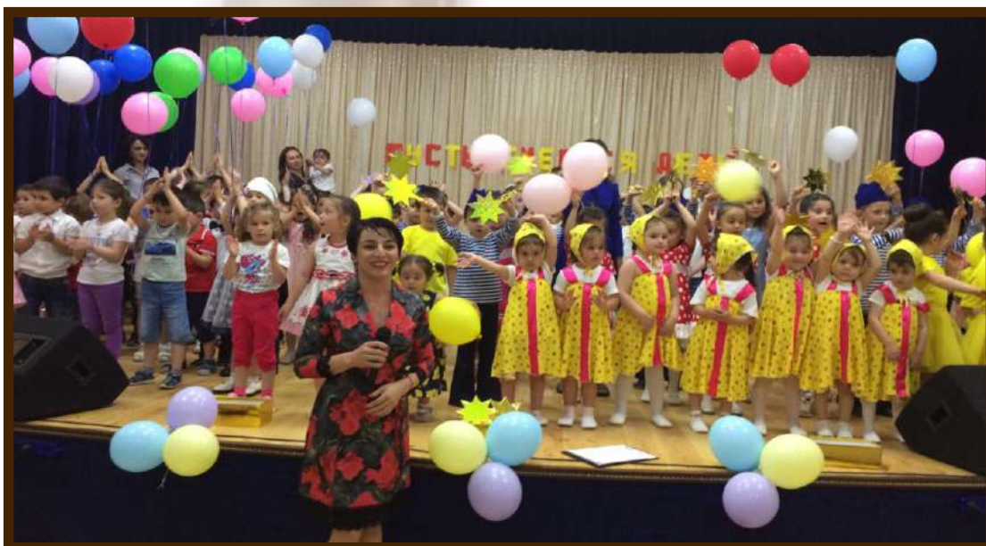
День защиты детей