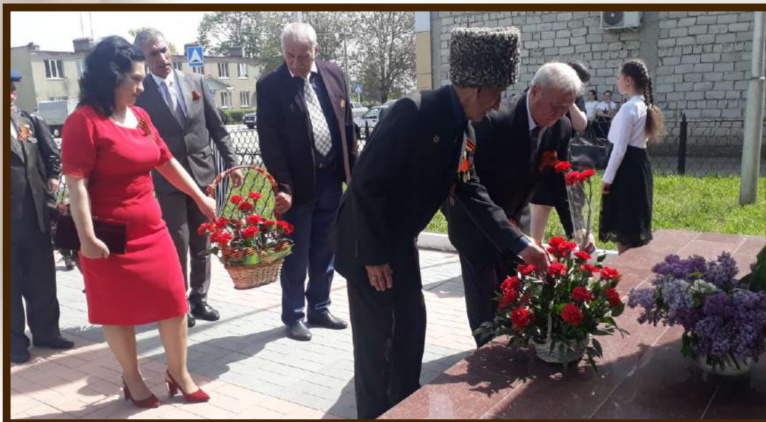
Возложение к памятнику погибшим односельчанам в ВОВ