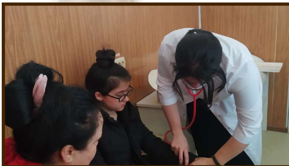
Кабинет педиатра в СВА