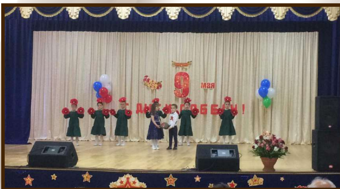
Выступление воспитанников дошкольного отделения