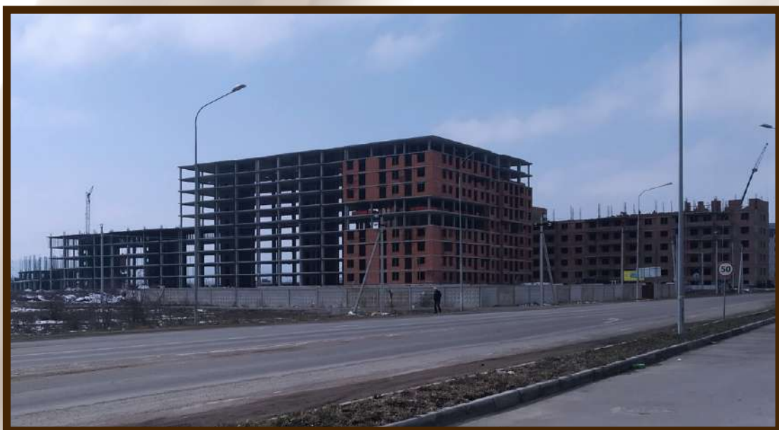
Строительство многоэтажных жилых зданий в с.п.Шалушка