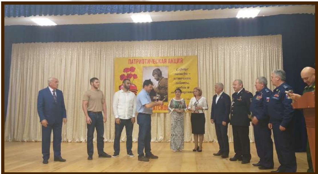
Встреча с Героями России на патриотической акции