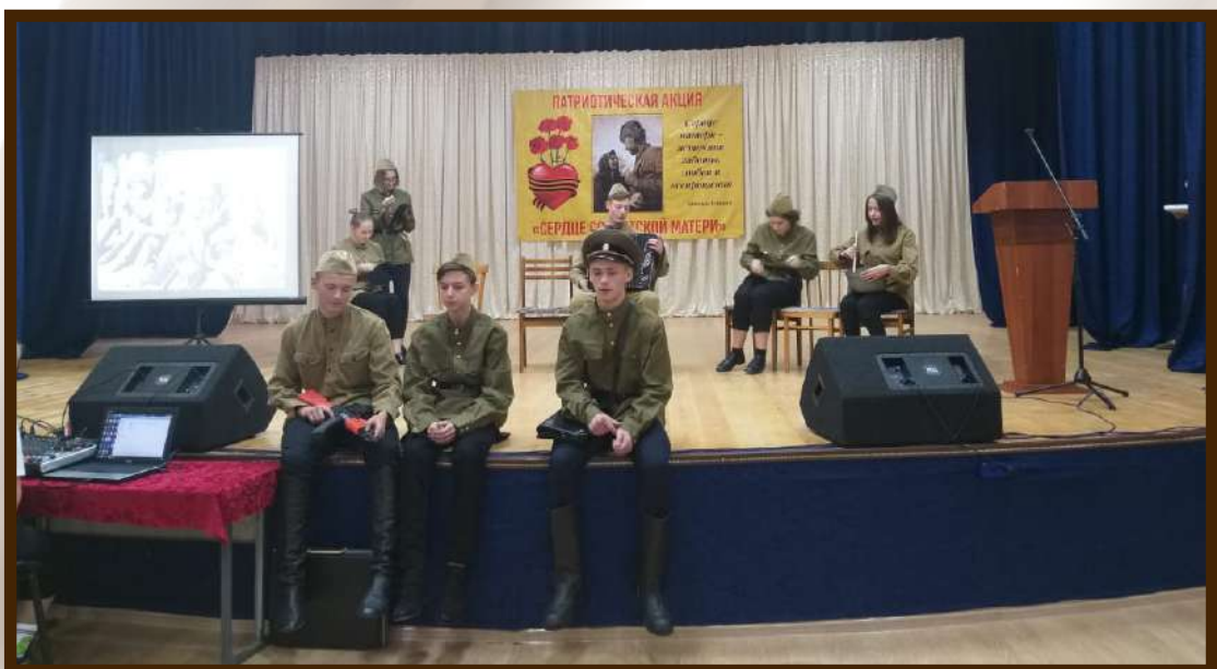
Выступление учащихся на патриотической акции ко Дню матери