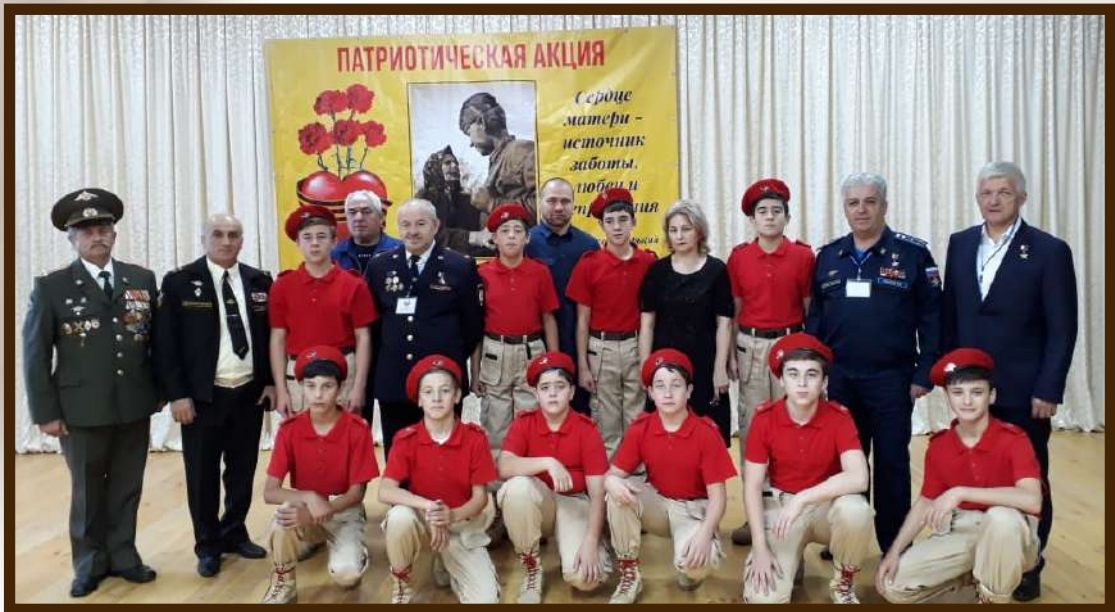
Патриотическая акция ко Дню матери