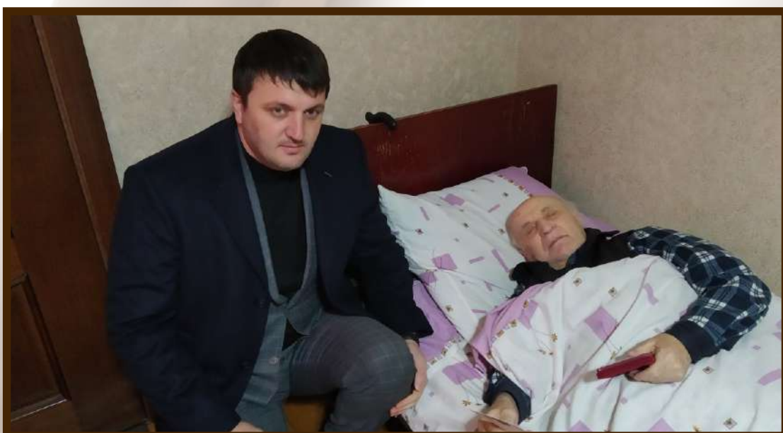
Вручение юбилейных медалей в честь 75-летия Победы в ВОВ