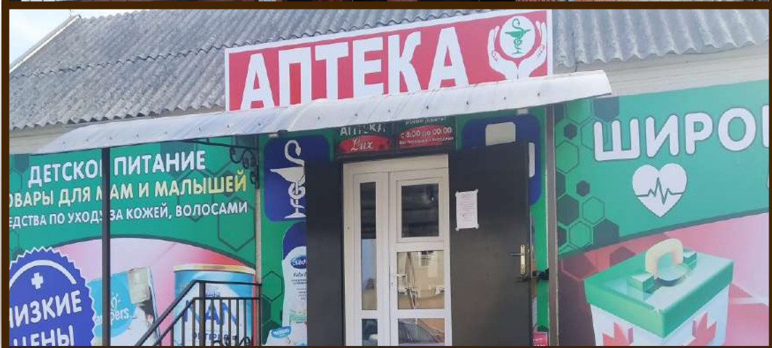
Сеть магазинов в с.п.Шалушка