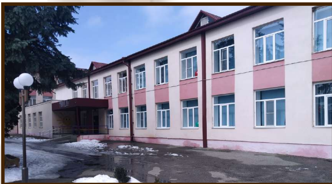
ДОУ МКОУ СОШ №2 с.п. Шалушка