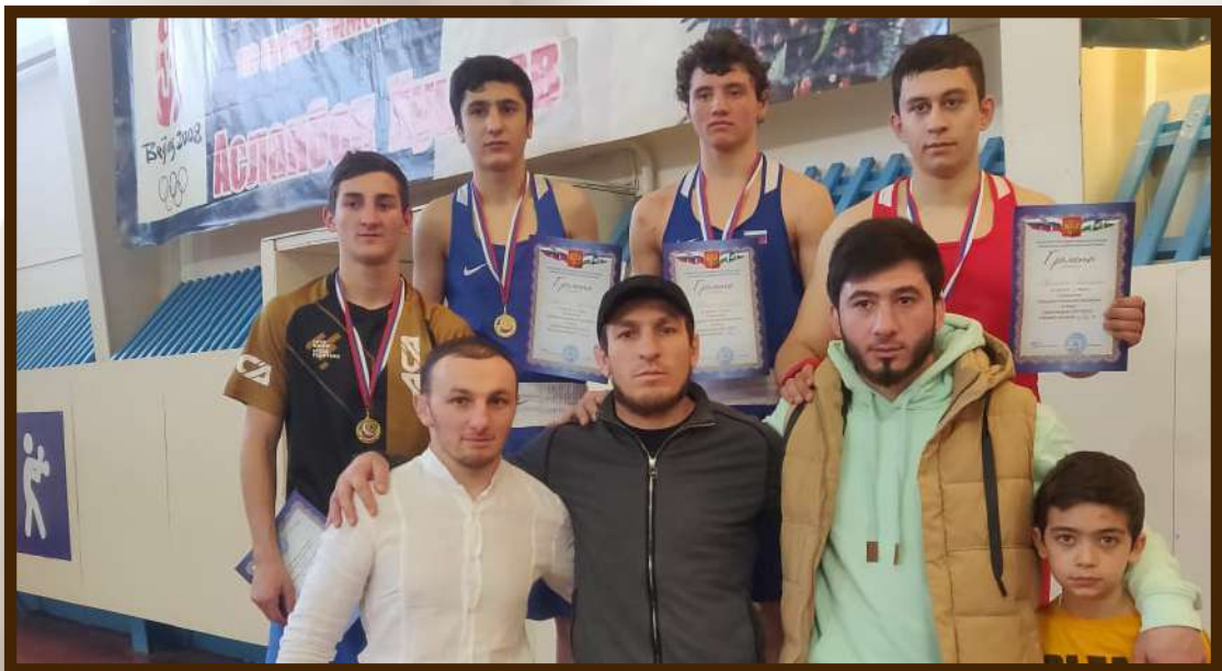
Титулованные спортсмены с.п.Шалушка