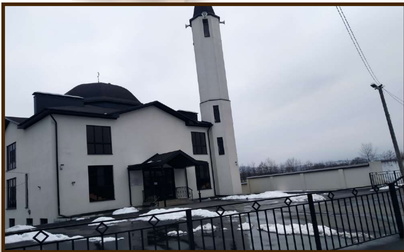
Новая мечеть в сельском поселении