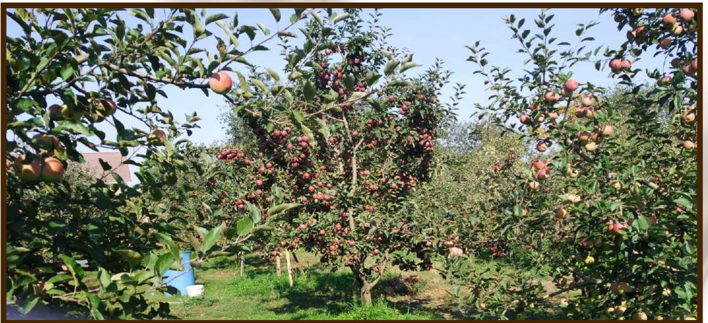
Основной вид деятельности в с.п. Шалушка садоводство