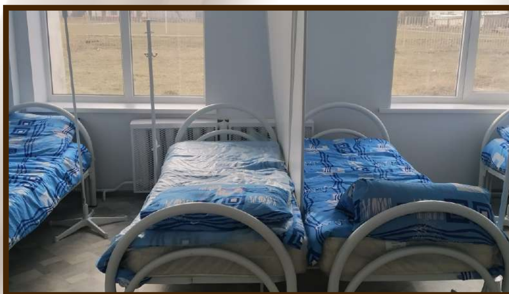
Дневной стационар в СВА