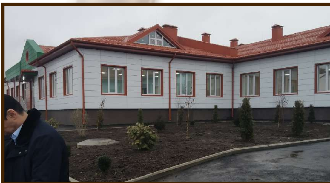
Визит Главы Республики с рабочей поездкой в новый детский сад с.п.Шалушка