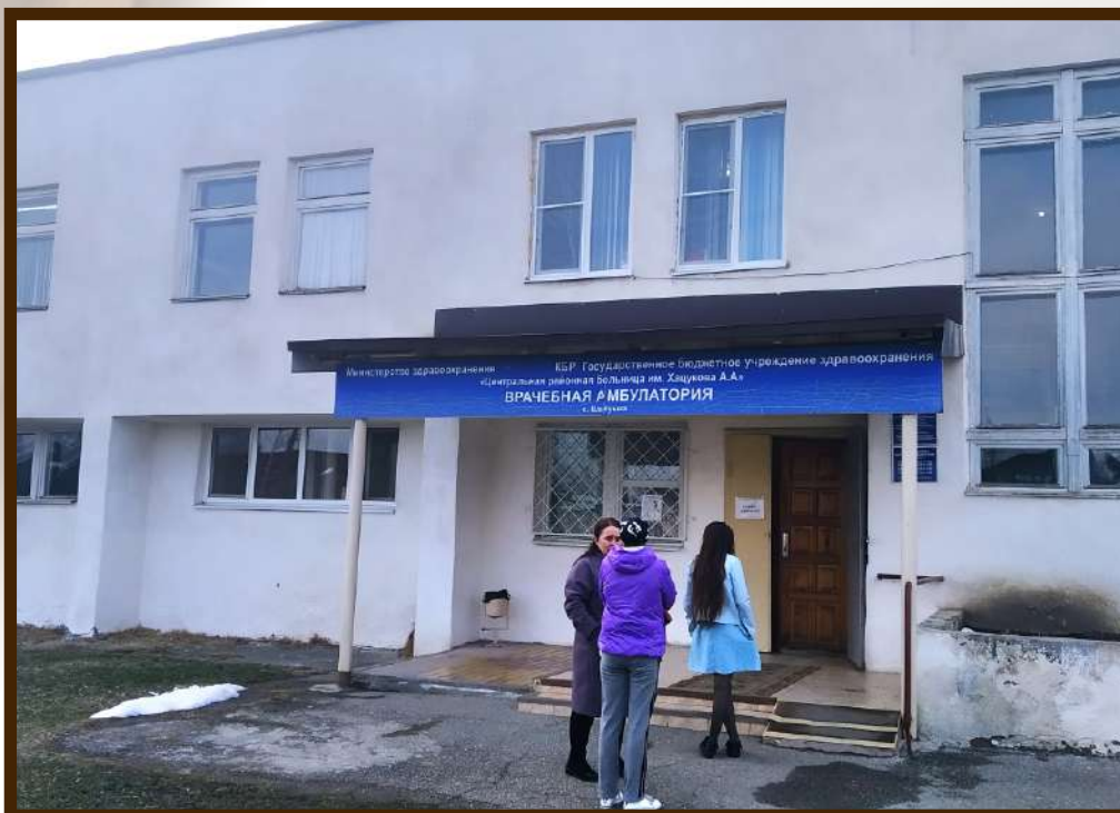
Сельская врачебная амбулатория с.п. Шалушка