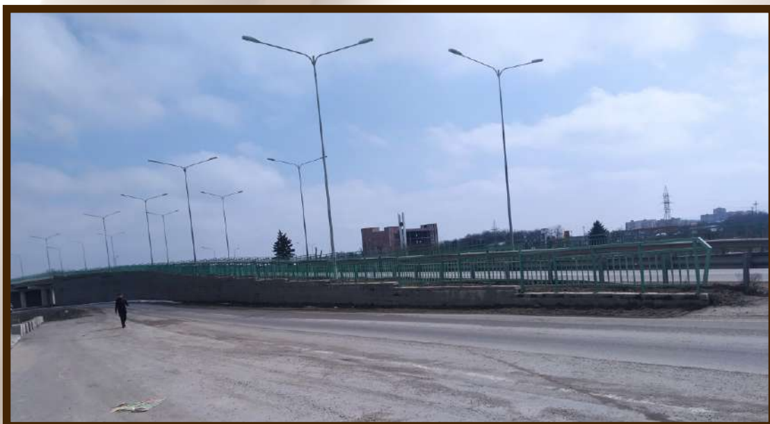
Развязка на Федеральной дороге Кавказ при въезде в с.п. Шалушка