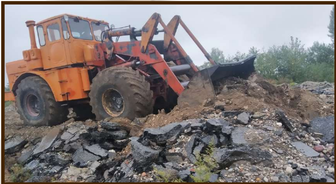
Санитарная очистка поймы реки Шалушка