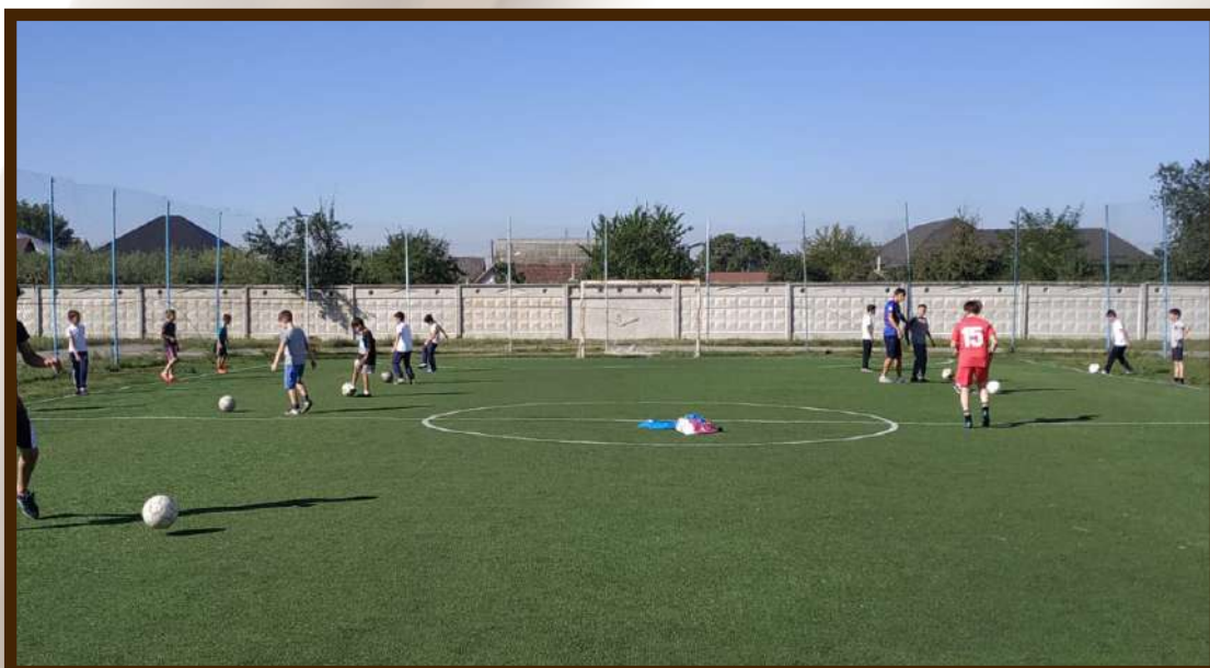
Юные футболисты с.п.Шалушка на тренировке