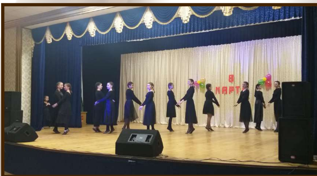
Выступление танцевального коллектива музыкальной школы 8 марта