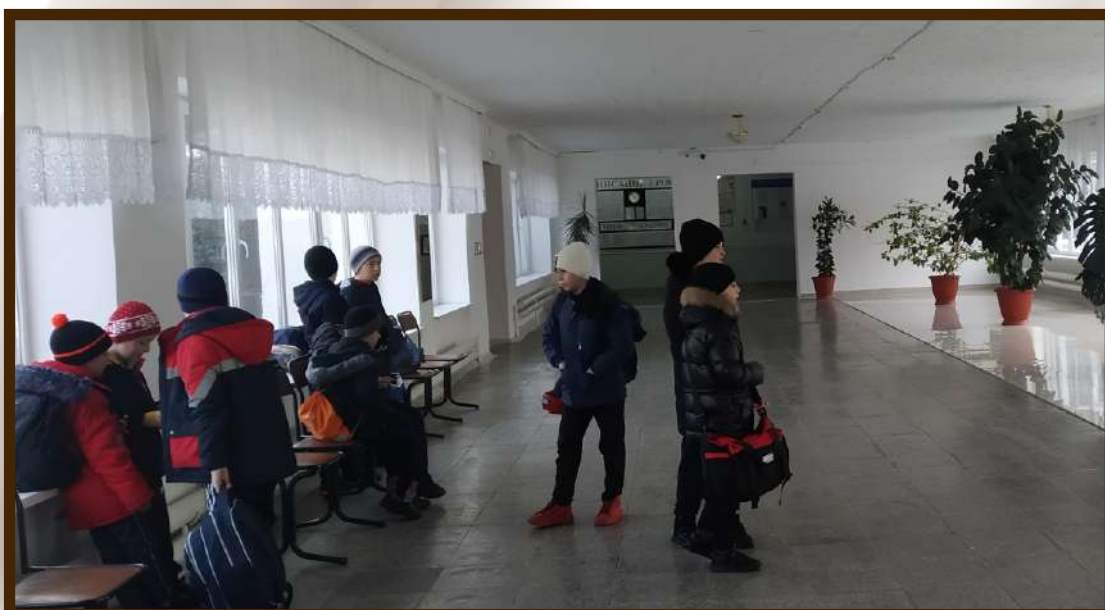
ДОУ МКОУ СОШ №1 с.п. Шалушка