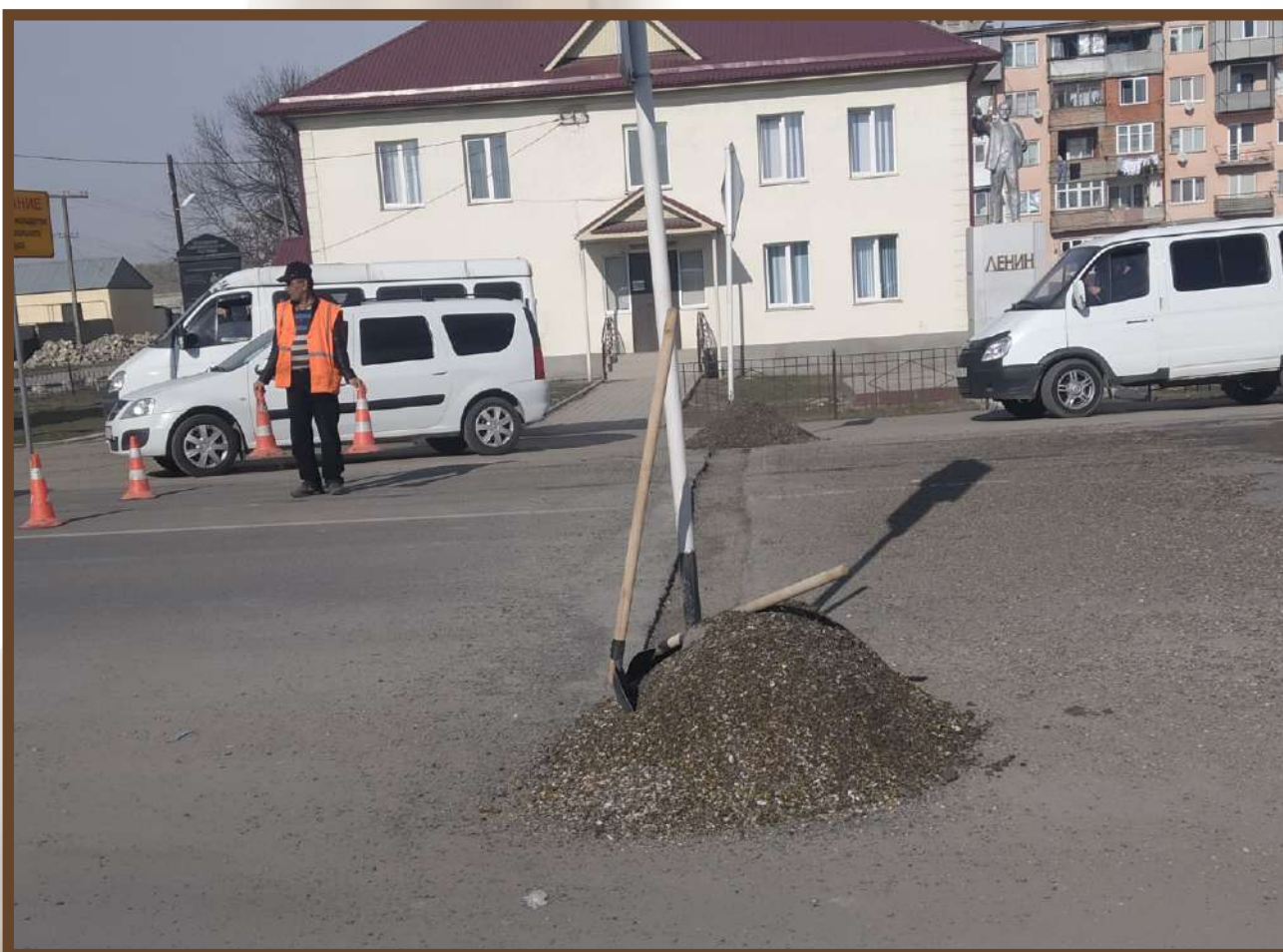
Укладка неровности по ул. Ленина