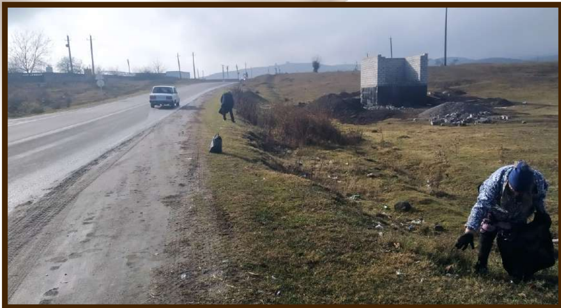
Санитарная очистка пастбищных угодий