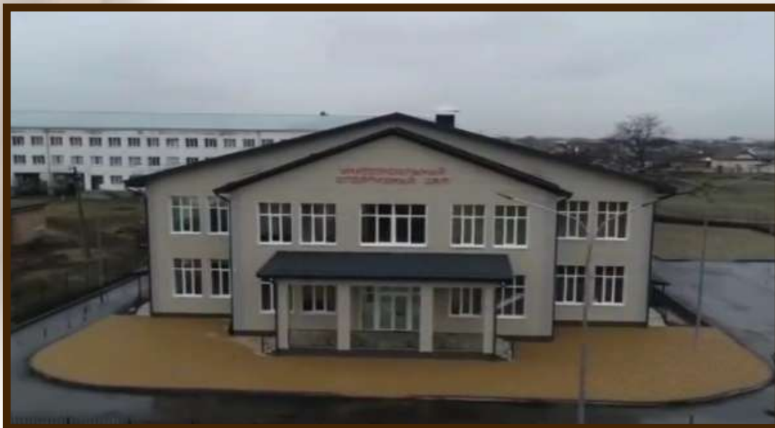
Универсальный спортивный зал