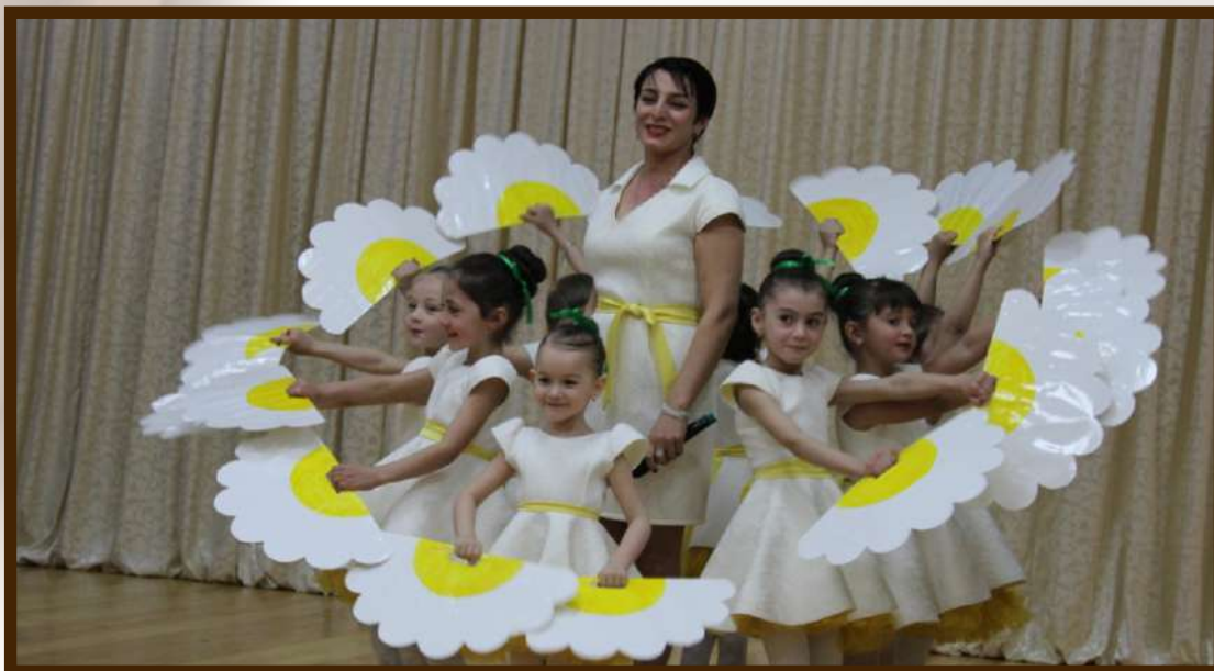
Праздник Весны и Труда 1 мая