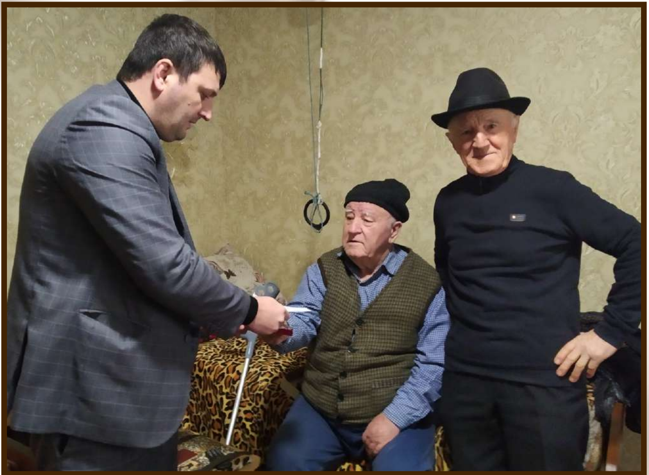
Вручение юбилейных медалей в честь 75-летия Победы в ВОВ