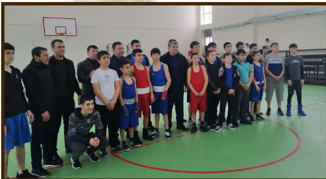
Визит Главы Республики Кокова К.В. с рабочей поездкой в с.п.Шалушка