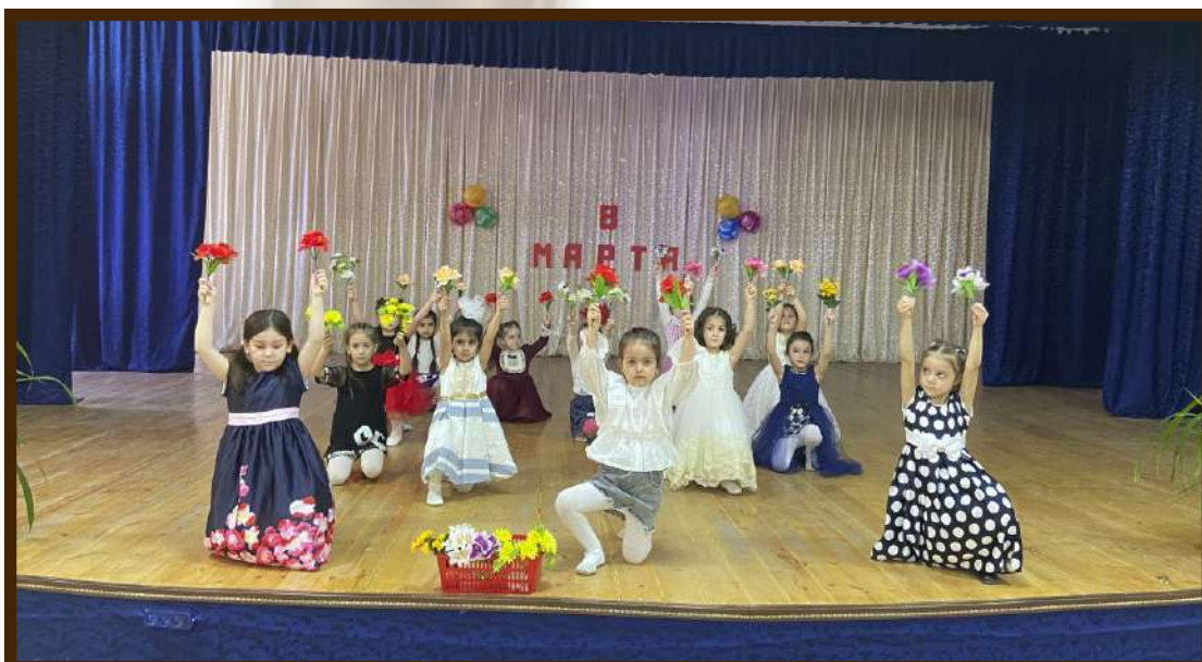
Международный женский день