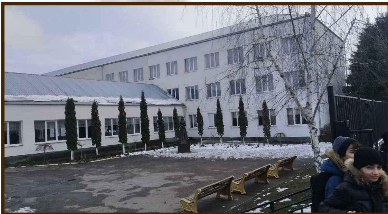
ДОУ МКОУ СОШ №1 с.п. Шалушка

В школах и учреждениях села ежегодно проводятся занятия по эвакуации людей в случае пожара, доступны запасные выходы.